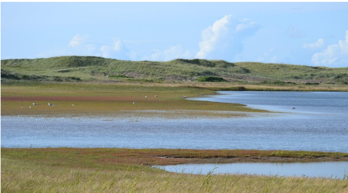
Fra Agger Tange