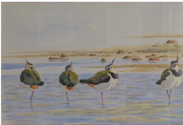
Viber på Vigelsø Akvarel af Jens Frimer

I mindelunden er der toiletter, og en overdækket hytte med siddepladser.